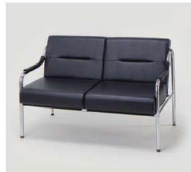
SC-1104 ロビーチェア(2人掛)

サイズ: W600×D720×H730×SH400 仕様: 張材 / レザーブラック フレーム / スチールクロームメッキ