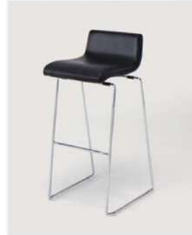
SC-1211 ¥6,500 カウンターチェア

サイズ: W420×D480×SH760 仕様: 座面 / レザーホワイト フレーム / スチールクロームメッキ