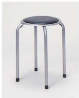
SC-1308 ¥1,200 スツール