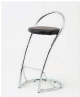
SC-1207 ¥5,000 カウンターチェア

サイズ: W490×D560×H885~1095 仕様: 座面/レザーホワイト フレーム/クロームメッキ 昇降式 (SH610~820)