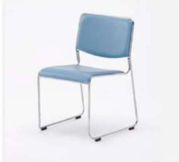
SC-802 アームレスチェア