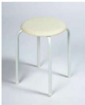
SC-1314 ¥1,200 白スツール