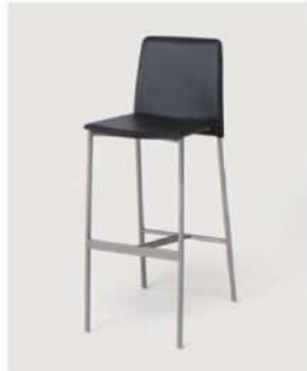
SC-1208 ¥6,500 カウンターチェア

サイズ: W450×D450×H1010×SH580~800 仕様: 座面/樹脂成型品ブラック フレーム/スチールクロームメッキ