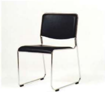
SC-805 アームレスチェア

サイズ: W480×D525×H740×SH420 仕様: 張材/レザーホワイト フレーム/スチールクロームメッキ