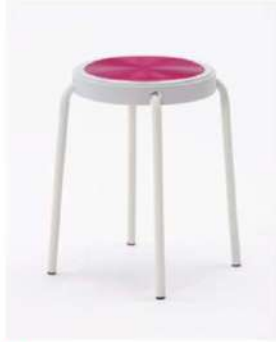
SC-1301 ¥1,200 スツール

サイズ: φ300×SH440 仕様: 座面/ポリプロピレンレッド フレーム/スチール