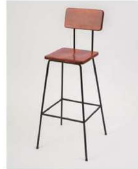
SC-170 ¥3,500 アンティークカフェチェア

サイズ: W420×D480×SH760 仕様: 座面 / レザーブラック フレーム / スチールクロームメッキ