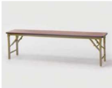
SC-142A ¥5,500 ベンチ

サイズ: W1500×H400/500/600×D300 仕様: 張材/レザーグレー フレーム/スチールクロームメッキ 高さ調整3段階・ベース60×350