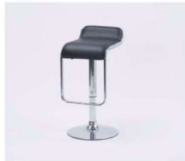
SC-31B カウンターチェア

サイズ: W350×D440×SH550~750 仕様: 座面/合成皮革 フレーム/スチールクロームメッキ