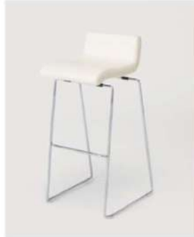
SC-1210 ¥6,500 カウンターチェア

サイズ: W420×D450×SH720 仕様: 座面 / 成形合板 フレーム / スチールクロームメッキ