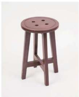
SC-1350 ¥2,500 ボタンスツール