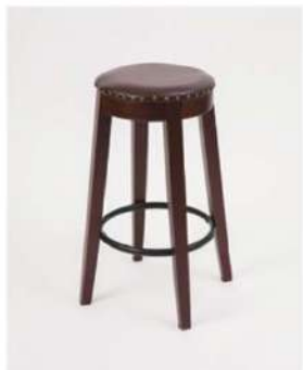
SC-1371 ¥3,500 アンティークスツール