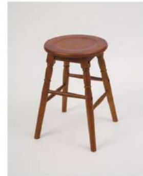
SC-1351 ¥2,500 木製スツール