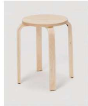
SC-1309 ¥1,200 スツール

サイズ: φ360×H455 仕様: 座面/木目調 フレーム/スチールクロームメッキ