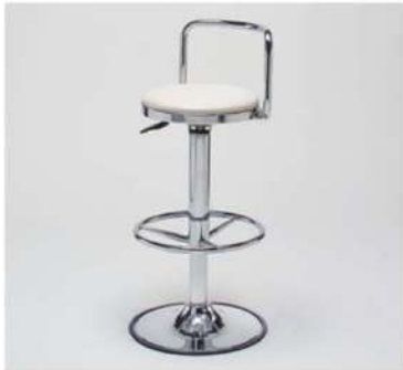
SC-30A カウンターチェア