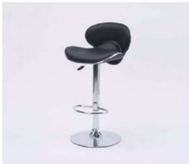
SC-307 カウンターチェア