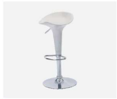
SC-172A カウンターチェア

サイズ: W350×D440×SH550~750 仕様: 座面/合成皮革 フレーム/スチールクロームメッキ