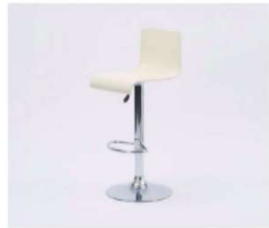
SC-309 カウンターチェア

サイズ: W345×D385×SH550~750 仕様: 座面/アクリル フレーム/スチールクロームメッキ