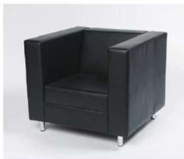
■ SC-219 ソファ

サイズ: W830×D750×H710×SH380 仕 様: ビニールレザーホワイト