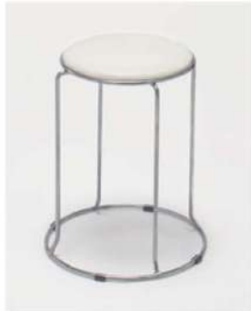
SC-1305 ¥2,500 スツール

サイズ: φ360×H460 仕様: 座面/レザーホワイト フレーム/スチールクロームメッキ