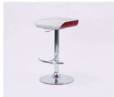
SC-171A カウンターチェア

サイズ: W375×D385×SH600~800 仕様: 座面/ABS樹脂 フレーム/スチールクロームメッキ