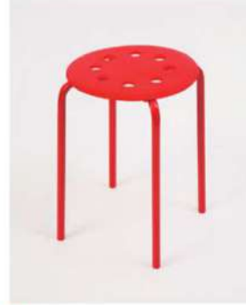
SC-1313 ¥1,000 POPスツール

サイズ: φ300×SH440 仕様: 座面/ポリプロピレンブルー フレーム/スチール