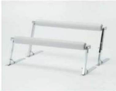
SC-901/903 ¥7,000 パイプベンチ

サイズ: W1500×H450/550/700(901) W1200×H450/550/700(903) 仕様: 張材/レザーグレー 座面/140φ フレーム/スチールクロームメッキ 高さ調整3段階・ベース75×600