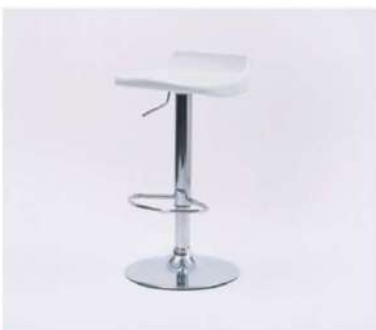
SC-170A カウンターチェア

サイズ: W380×D360×SH600~800 仕様: 座面/ABS樹脂 フレーム/スチールクロームメッキ