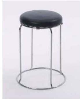
SC-1306 ¥2,500 スツール

サイズ: φ360×H460 仕様: 座面/レザーホワイト フレーム/スチールクロームメッキ