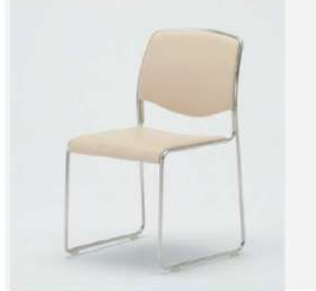
SC-803 アームレスチェア

サイズ: W480×D525×H740×SH420 仕様: 張材/レザーブルー フレーム/スチールクロームメッキ