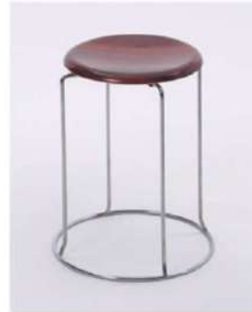
SC-1307 ¥2,500 スツール

サイズ: φ360×H490 仕様: 座面/レザーブラック フレーム/スチールクロームメッキ