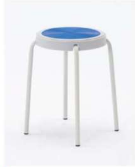
SC-1302 ¥1,200 スツール

サイズ: φ300×SH440 仕様: 座面/ポリプロピレンレッド フレーム/スチール