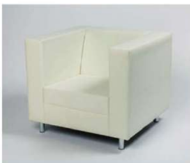
■ SC-218 ソファ