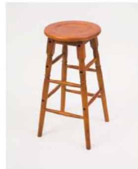
SC-1352 ¥2,500 木製スツール