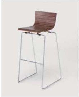
SC-1209 ¥6,500 カウンターチェア

サイズ: W420×D450×SH720 仕様: 座面 / 成形合板 フレーム / スチールクロームメッキ