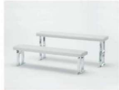
SC-1001 ¥7,000 スリムベンチ

サイズ: W1500×H450/550/700(902) W1200×H450/550/700(904) 仕様: 張材/レザーブラック 座面/140φ フレーム/スチールクロームメッキ 高さ調整3段階・ベース75×600