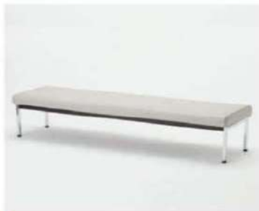
SC-601 ¥6,000 長椅子

サイズ: W1200×D420×H420(141A) W1500×D420×H420(141B) 仕様: 座面/木製ブラック 折畳み式