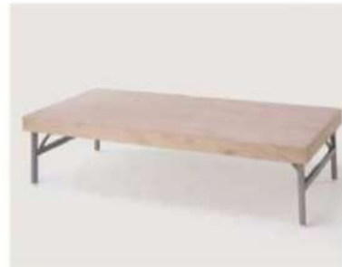
SC-142B/142C ¥4,500 床台

サイズ: W1800×D600×H420(142B) W1800×D900×H420(142C) 仕様: 座面/ベニヤ