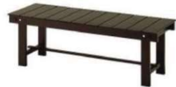
SC-141A/141B 縁台 ¥5,000(A)/¥5,500(B)

サイズ: W1800×D600×H420(142B) W1800×D900×H420(142C) 仕様: 座面/ベニヤ