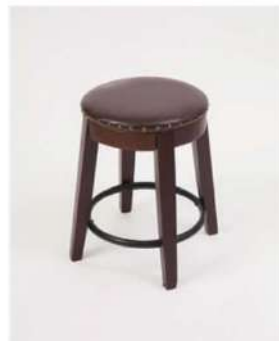
SC-1370 ¥3,500 アンティークスツール