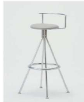
SC-1202 ¥4,500 カウンターチェア

サイズ: W340×D360×H870×SH710 仕様: 座面/レザーブラック座面φ340 フレーム/スチールブラック