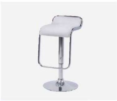
SC-31A カウンターチェア

サイズ: W380×D410×SH550~750 仕様: 座面/成形合板 フレーム/スチールクロームメッキ