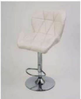
SC-32B ¥4,500 カウンターチェア

サイズ: W380×D380×H800×SH700 仕様: 座面/レザーグレー座面φ290 フレーム/スチールクロームメッキ