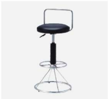
SC-306 カウンターチェア