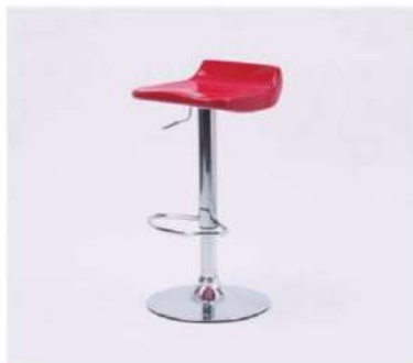
SC-170B カウンターチェア

サイズ: W375×D385×SH600~800 仕様: 座面/ABS樹脂 フレーム/スチールクロームメッキ