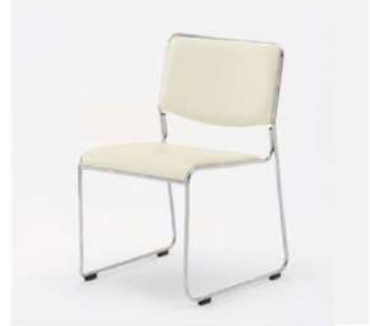
SC-804 アームレスチェア

サイズ: W480×D525×H740×SH420 仕様: 張材/レザーアイボリー フレーム/スチールクロームメッキ