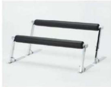
SC-902/904 ¥7,000 パイプベンチ

サイズ: W1500×H450/550/700(901) W1200×H450/550/700(903) 仕様: 張材/レザーグレー 座面/140φ フレーム/スチールクロームメッキ 高さ調整3段階・ベース75×600