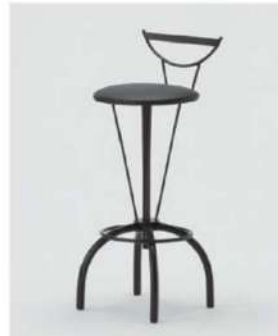
SC-1201 ¥4,500 カウンターチェア

サイズ: W400×D500×SH730 仕様: 座面/レザーブラック フレーム/スチールシルバー