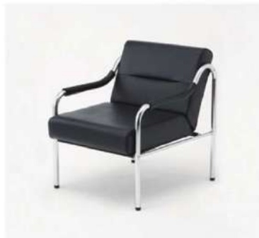
SC-1103 ロビーチェア(1人掛)

サイズ: W800×D700×H770 仕様: 座面 / 布張りダークグレー 脚 / 木製ナチュラル