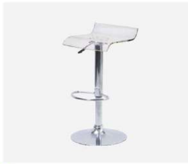
SC-308 カウンターチェア

サイズ: W460×D470×SH600~750 仕様: 張材/PVCLレザー フレーム/スチールクロームメッキ