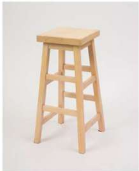
SC-1354 ¥2,500 スクエアスツール

サイズ: W420×D420×H975×SH705 仕様: 座面・背もたれ / 木製 フレーム / スチール