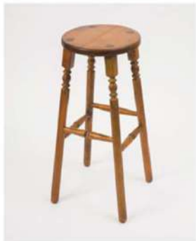
SC-1353 ¥2,500 木製スツール