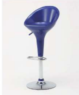
SC-1711 ¥6,500 カウンターチェア

サイズ: W460×D400×SH670~890 仕様: 座面/ラタン調 フレーム/スチールクロームメッキ