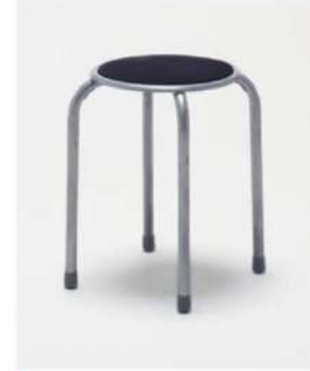
SC-1304 ¥1,200 スツール

サイズ: φ320×H450 仕様: 座面/プラスチックレッド フレーム/スチールレッド