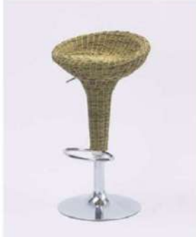
SC-310 ¥6,500 カウンターチェア

サイズ: W460×D400×SH670~890 仕様: 座面/ラタン調 フレーム/スチールクロームメッキ