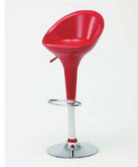
SC-1712 ¥6,500 カウンターチェア

サイズ: W450×D450×H1010×SH580~800 仕様: 座面/樹脂成型品ブルー フレーム/スチールクロームメッキ