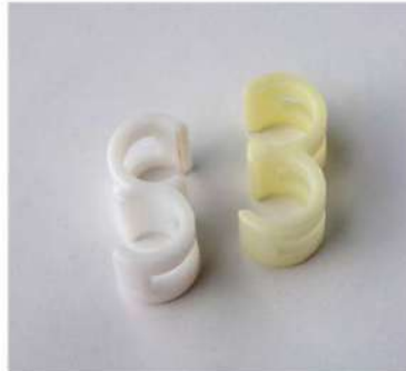
パイプス繋ぎパーツ

サイズ: W440×D450×H800×SH470 仕様: 張材/レザーホワイト フレーム/スチールホワイト