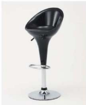
SC-1714 ¥6,500 カウンターチェア

サイズ: W450×D450×H1010×SH580~800 仕様: 座面/樹脂成型品ホワイト フレーム/スチールクロームメッキ