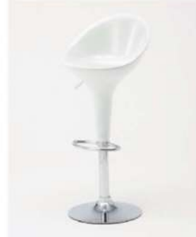
SC-1713 ¥6,500 カウンターチェア

サイズ: W450×D450×H1010×SH580~800 仕様: 座面/樹脂成型品レッド フレーム/スチールクロームメッキ